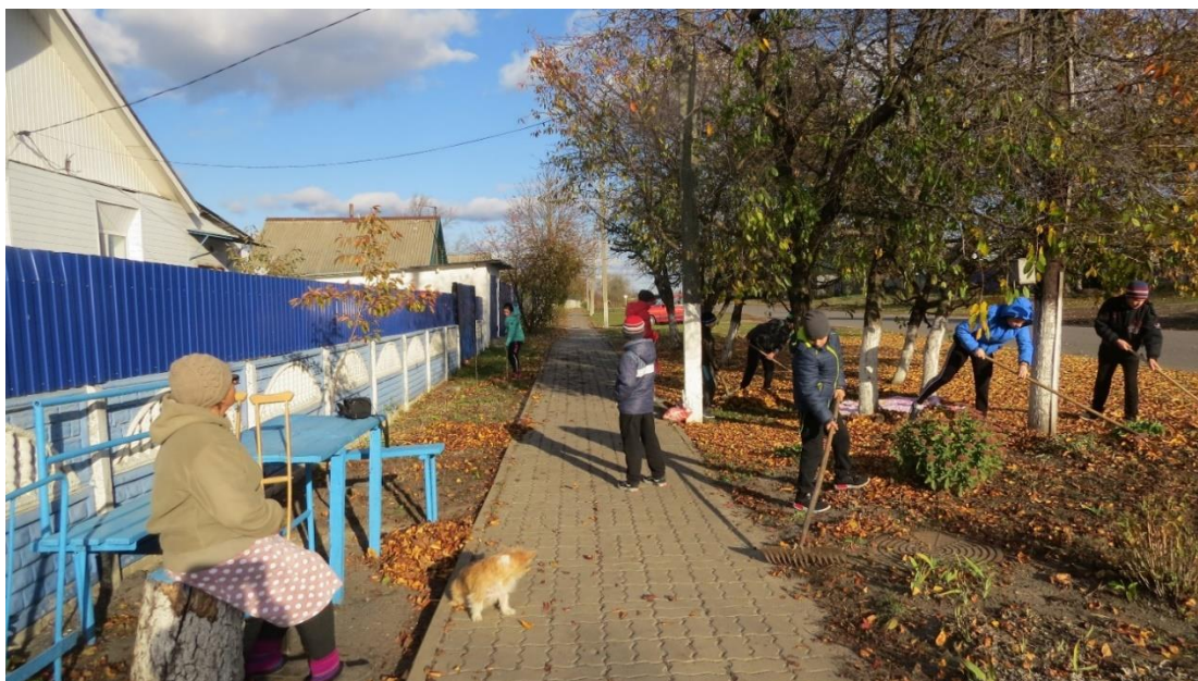
Уборка во дворах