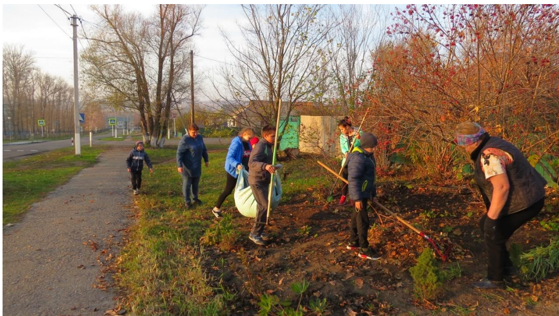
Акция «Чистый двор»