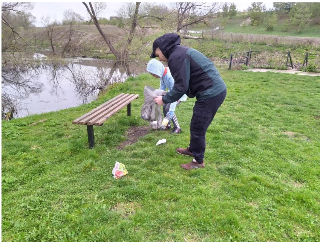
Уборка мусора на кринице «Крейдянка»