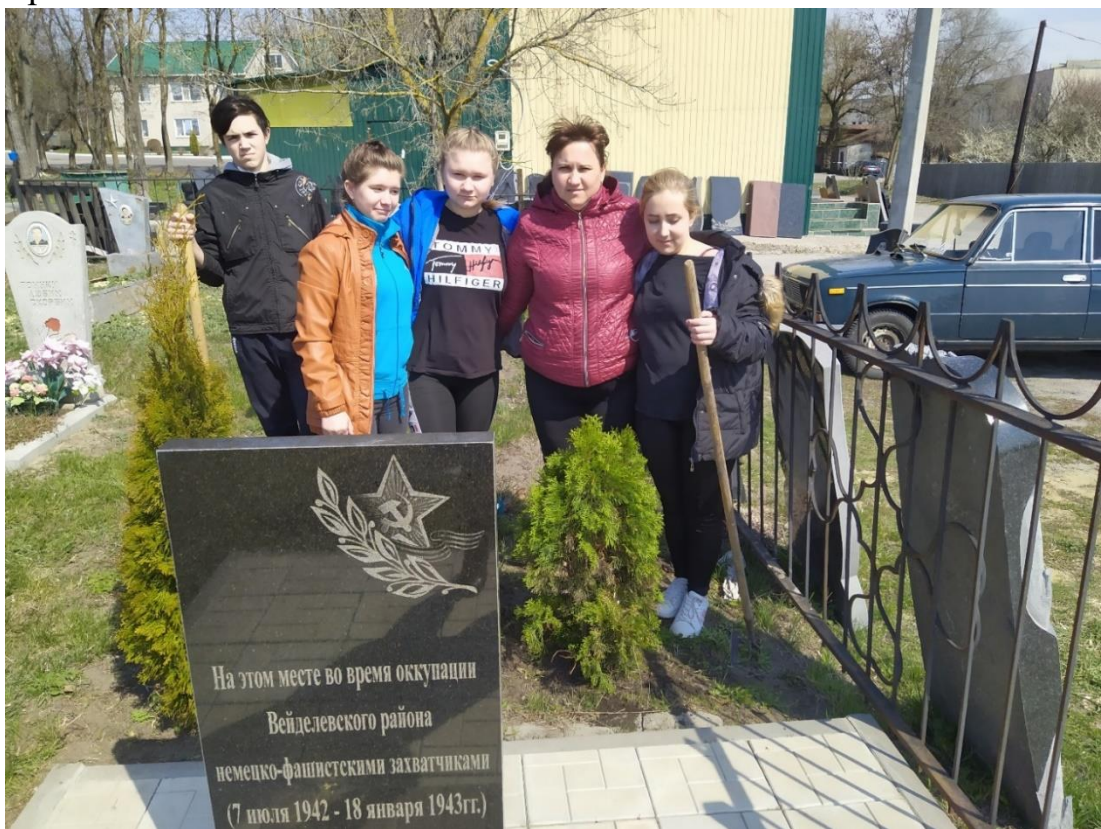
Акция «Никто не забыт»