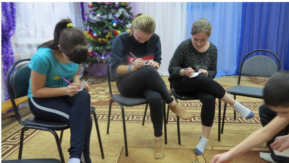
Тренинги на сближение