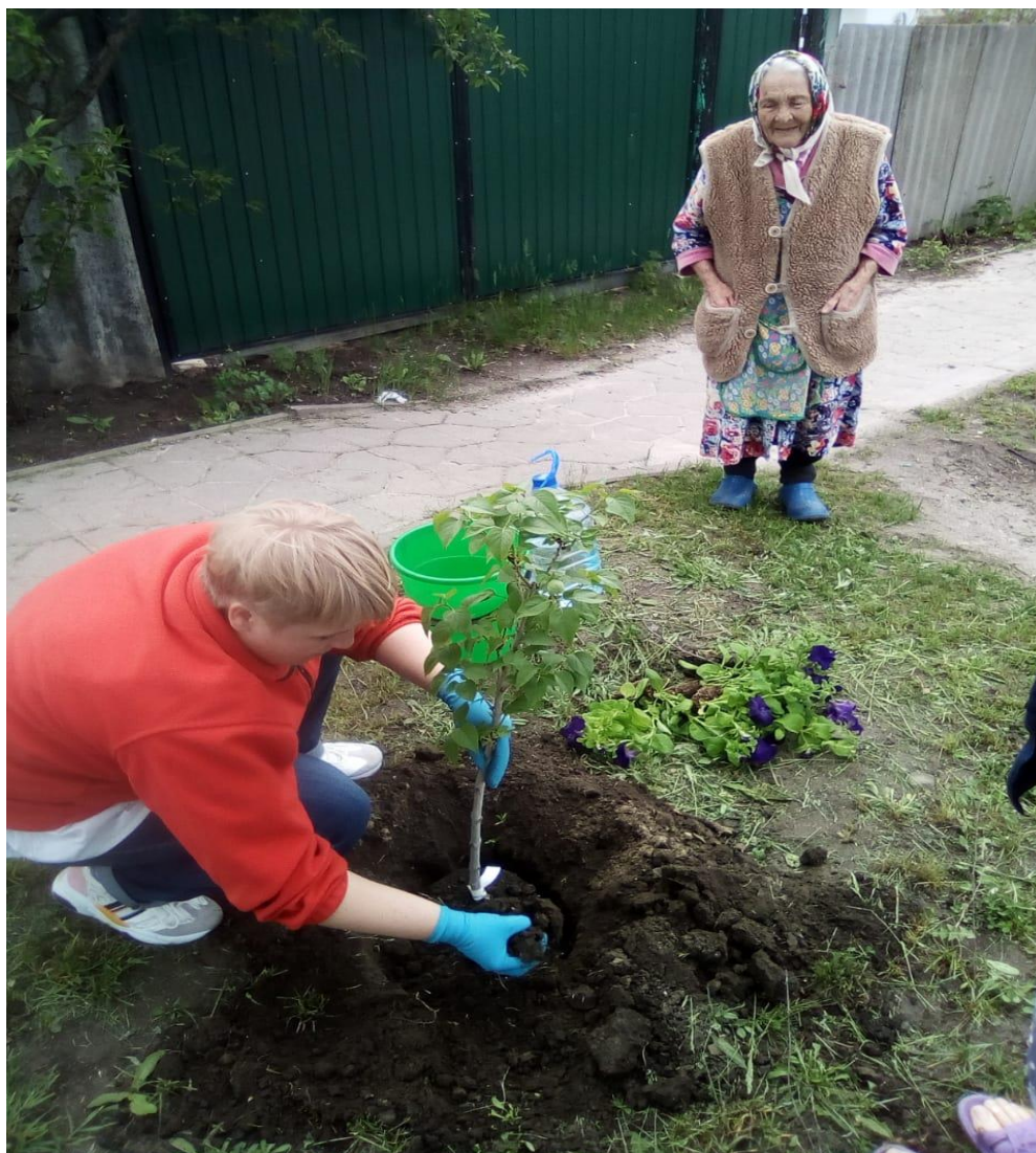
Акция «Ветеран живет рядом»