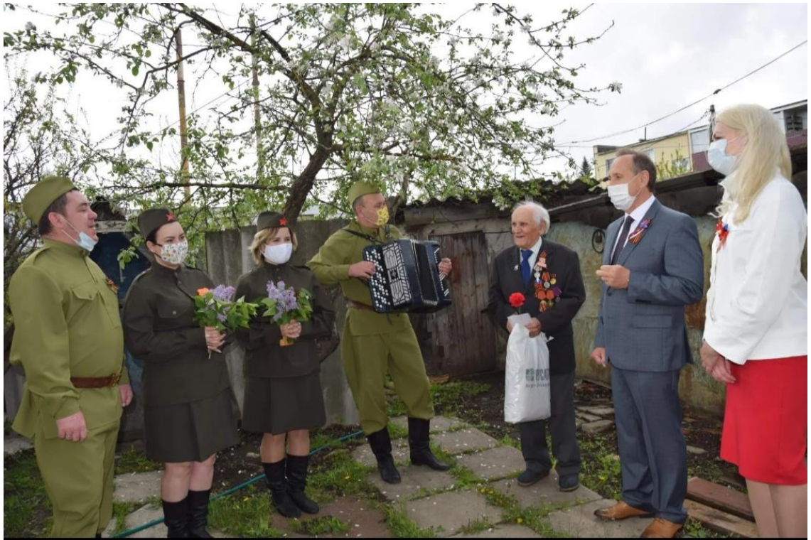
Акция «Георгиевская ленточка»