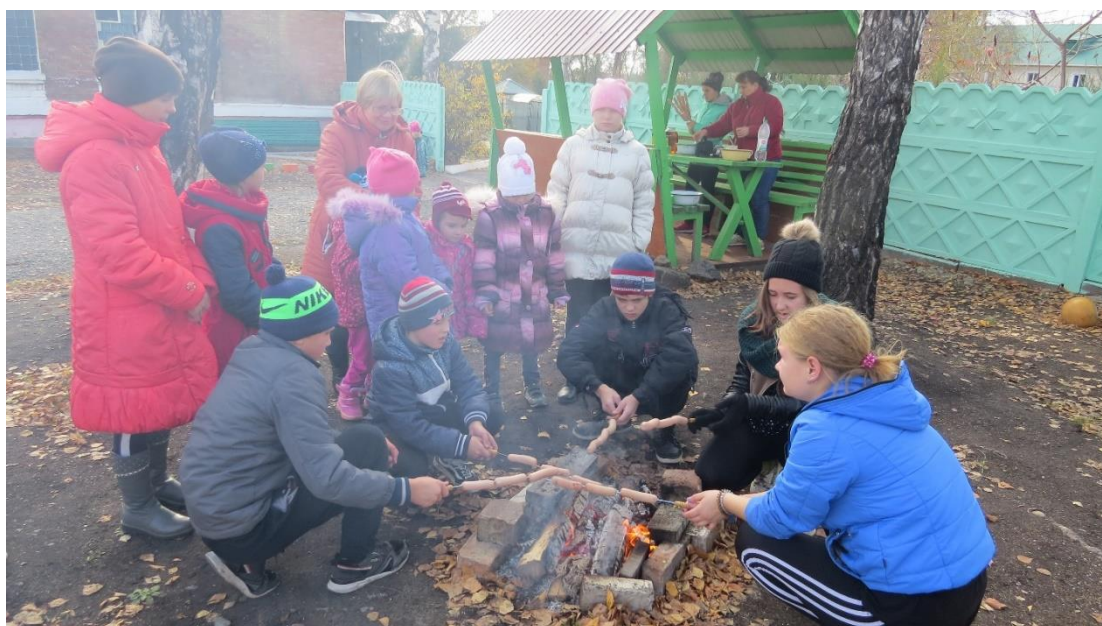
Международный день туризма