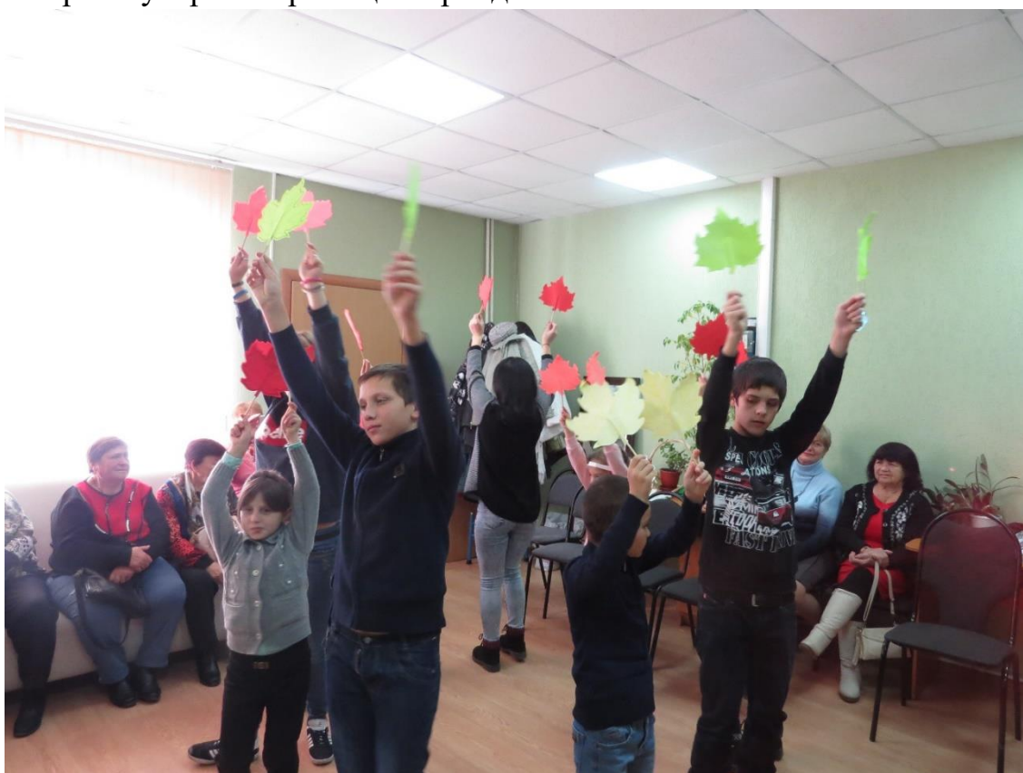
Поздравление ветеранов, тружеников тыла с Днем народного единства